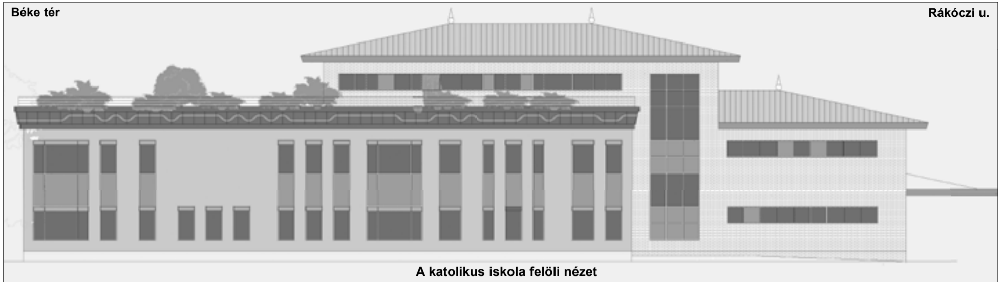
A katolikus iskola felőli nézet

Riporter: Láthatóan a polgármester úr programjában az év elején megfogalmazott tervek kezdenek testet öltetni. Nemrégiben a szennyvízberuházásra kiírt pályázat első fordulóján nyert a város, most ismét egy nagy jelentőségű fejlesztés – a Kistérségi Egészségügyi Központ- pályázata lett sikeres.