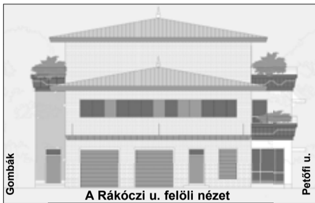
A Rákóczi u. felőli nézet

Három ultrahangos készüléket terveztünk, ebből csak kettő beszerzésére kaptunk engedélyt ebben a pályázatban.